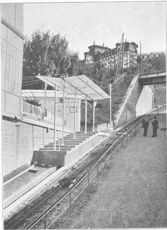
Fig. 11. — Halte du Splendide Hôtel pour le passage supérieur P.L.M. et vue du Royal Hôtel.

Cette ligne se compose de deux conducteurs en cuivre nu de 6 mm. de diamètre, suspendus de la façon employée généralement pour les lignes de tramways.