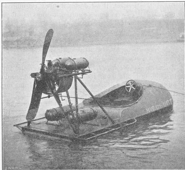
Fig. 2. — Le glisseur Nieuport.

Pratiquement, le plan AB est remplacé par une coque et des flotteurs appropriés, munis de redans . L'engin est mû par une hélice propulsive aérienne.