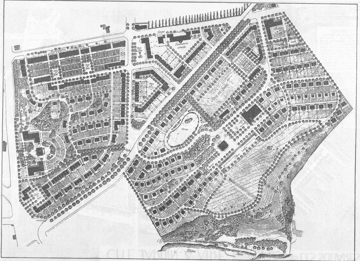
5 me prix : projet « La Madelon », de MM. Schnell, Laverrière et Thévenaz, architectes, à Lausanne. — Echelle 1 : 3000.