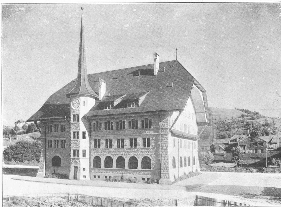
Façades nord et ouest.