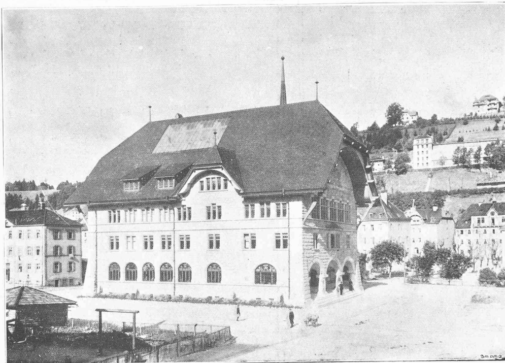
Façades sud et est.