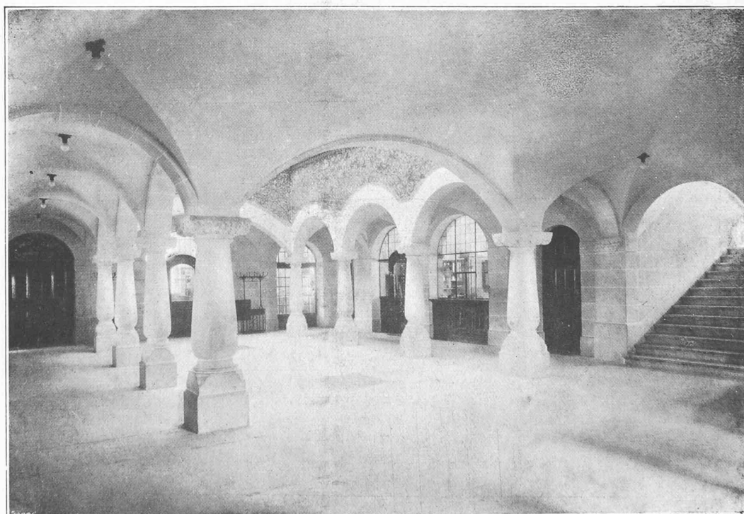
Vestibule du rez-de-chaussée.