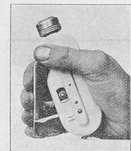
Fig. 2. — Lampe de poche électrique à magnéto. Modèle « Lucifer ».

La fig. 2 montre les dimensions de cette lampe par rapport à la main qui l'actionne. Pour produire l'éclairage, il suffit d'exercer