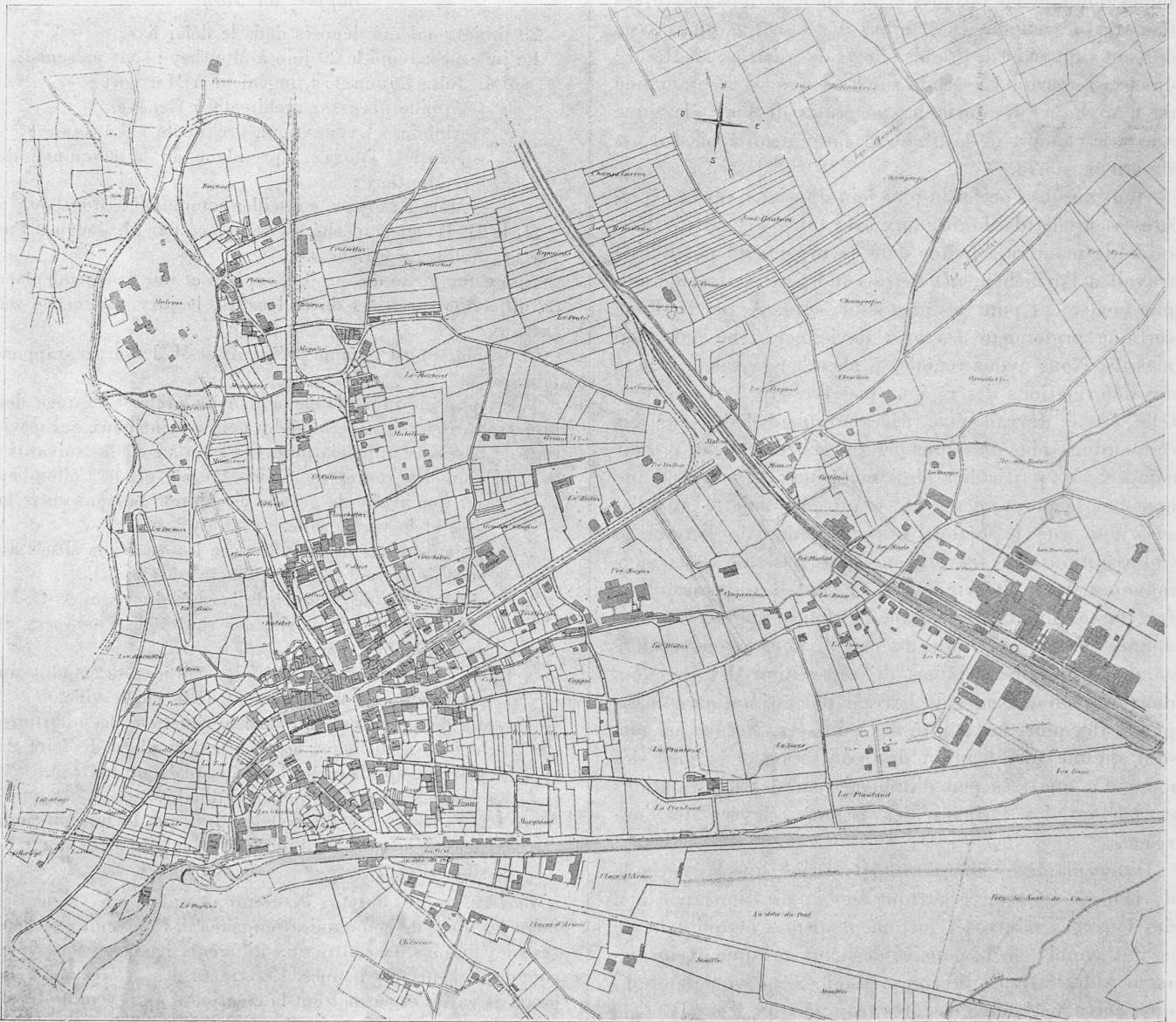
Fig. 1. — Plan de situation pris pour base du concours. — 1 : 40 000.