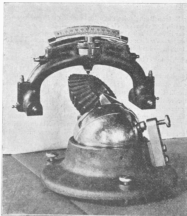
Le pendule Herbert pour la mesure de la dureté.