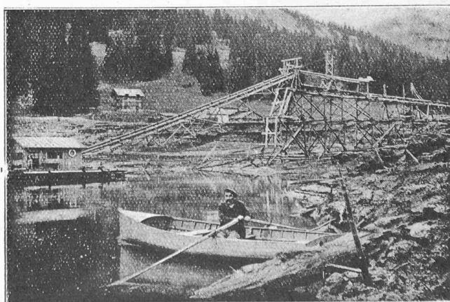
Fig. 40. — L'installation de pompage et l'estacade devant l'émissaire naturel du lac, le 20 novembre 1920, la première tranche d'eau de 9 m. 60 de profondeur étant évacuée.

Aussitôt après, on installa un siphon de 25 cm. de diamètre déversant dans ce même puits. Pompes et siphon évacuèrent ainsi dans les galeries plus de 700 litres d'eau par seconde au début de cette opération d'abaissement