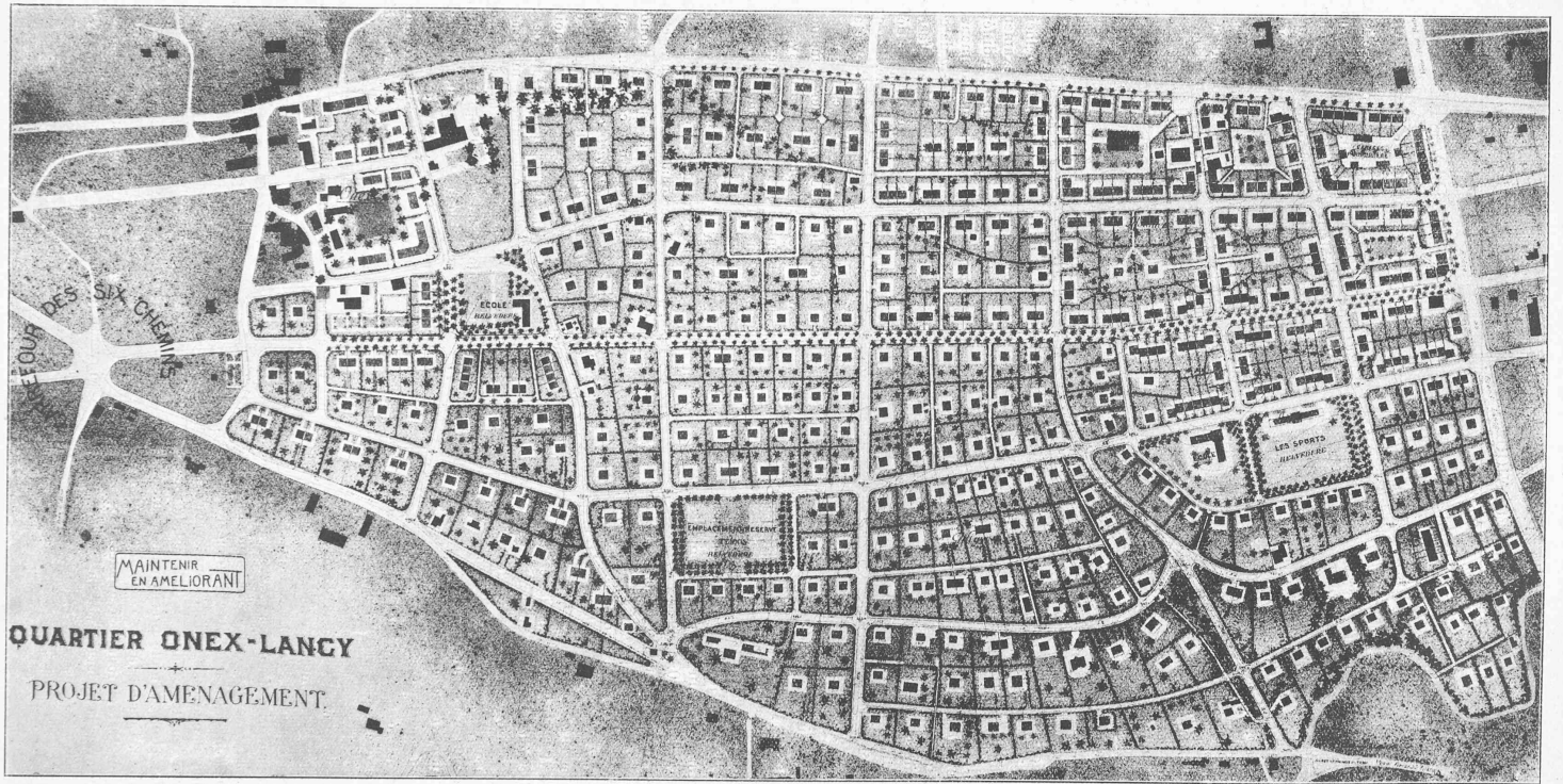
Projet «Maintenir en améliorant», classé au 4 e rang, de MM. Delessert et Mouchet , géomètres.