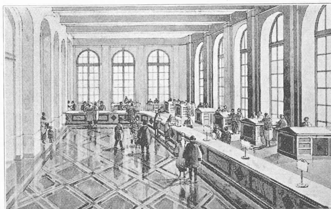
Vue du hall des guichets.