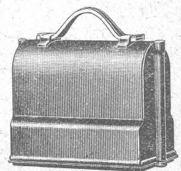
Niveau emballé, 1/6 grandeur naturelle

S. A. Henri Wild - Heerbrugg Téléphone 95 (St-Gall)