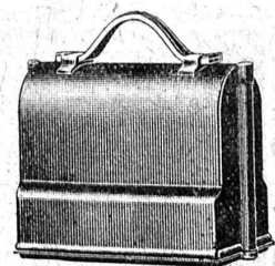
Niveau emballé, 1/6 grandeur naturelle

S. A. Henri Wild - Heerbrugg Téléphone 95 (St-Gall)