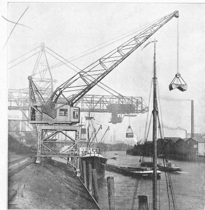
Fig. 2. — Grue de quai, à volée inclinable, dans sa position de portée maximum : 20 m.