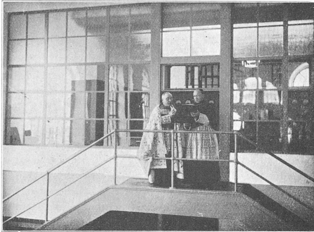
Fig. 33. — Bénédiction de l'usine, le 1 er octobre 1929.

Alternateurs. — L'alternateur N° 3 fut essayé très complètement à Baden en moteur synchrone, les résultats supérieurs à ceux garantis sont visibles dans les différentes