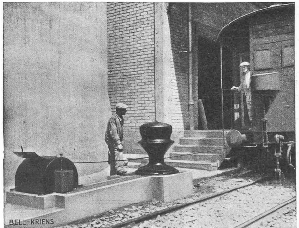
Fig. 2. — Cabestan avec enrouleur horizontal, demi-noyé.

L'enrouleur, commandé en sous-sol par le cabestan lui-même,