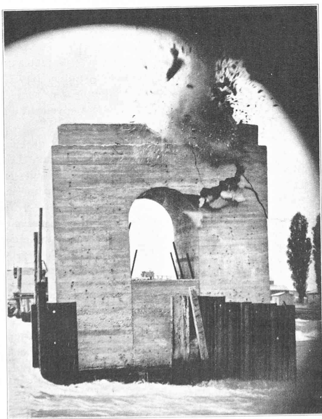
Fig. 6. — Démolition de la pile provisoire III av.

Ensuite on put plus tranquillement examiner les conséquences de cet accident. C'est d'ailleurs à la même époque que l'on dut tenir compte des nouvelles exigences des navigateurs et remanier le programme d'exécution suivi jusque-là. Le programme modifié ne nécessitait plus