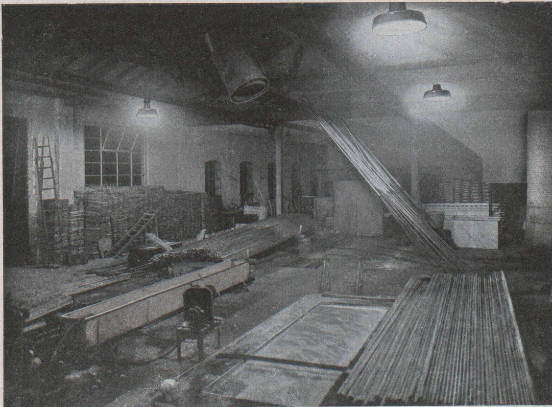
Zingage à la lumière de lampes Osram à vapeur de mercure (lumière bleu-verdâtre).

Ces deux vues extraites d'une élégante brochure, « Les lampes Osram à vapeur métallique pour le travail, la publicité et le trafic » mise à la disposition du public par Osram S. A. , à Zurich, (Limmatquai, 3) donnent une idée du parti avantageux que l'industrie peut tirer de ces lampes, dotées, outre la tonalité si caractéristique et précieuse de leur lumière, d'un rendement lumineux qui en fait les sources lumineuses les plus économiques d'aujourd'hui.