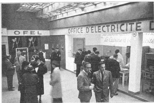
Stand de l'OFEL (Office d'électricité de la Suisse romande) au dernier Comptoir suisse.

Les stands de l'électricité au Comptoir Suisse ont attiré comme d'habitude de nombreux visiteurs. Si les démonstrations culinaires provoquent toujours un vif intérêt, les questions posées par maintes ménagères prouvent clairement que, depuis quelques années, une