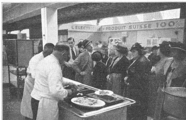
Stand de l'OFEL au dernier Comptoir suisse.