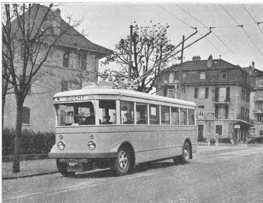
Fig. 3. — Voiture de la ligne Ouchy-La Gare.