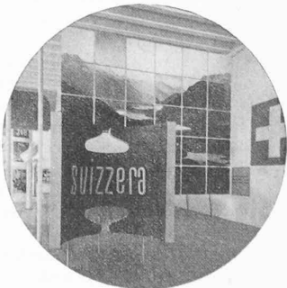
Fig. 4. — Max Bill : section suisse d'exposition à la Triennale Milan 1936.