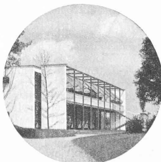
Fig. 3. — Banfi, Belgioiso, Peressutti, Rogers : Institut héliothérapeutique à Legnano.

Vingt réalisations architecturales (immeubles ou groupes d'immeubles) occupent tout l'ouvrage. Chacune est illustrée par une dizaine de photos dont celle des auteurs et par des