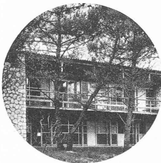
Fig. 1. — Le Corbusier : Maison de vacances aux Mathes (Océan).

Au contraire de ce qui s'est fait jusqu'à présent, Alfred Roth n'a pas donné de la jeune architecture une simple image de