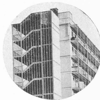
Fig. 2. — van Tijen et Maaskant : immeuble Bergpolder, à Rotterdam.

surface, effleurant cent sujets sans les aborder. Il a volontairement borné son choix pour donner une image en profondeur.