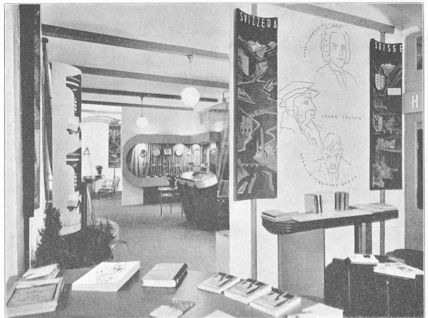
Vue générale de la Section suisse à la foire de Leipzig, 1941.

La section industrielle groupe trois activités dans un local constitué par les deux travées suivantes. On y parvient en traversant le tourisme, mais, par les baies vitrées du dégagement central, le visiteur qui ne serait pas entré dans le stand embrasse néanmoins d'un seul coup d'œil l'aménagement d'ensemble des produits exposés. La vitrine de l'horlogerie, où quatorze industriels de la montre exposent plus de septante pièces, occupe le premier angle. Une partie des pièces exposées