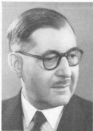
Dr ès sc. techn. Karl Kobelt,

La S.I.A. félicite M. le conseiller fédéral Streuli pour sa brillante élection et souhaite à ses deux membres au sein du Conseil fédéral plein succès dans leur activité au service de la nation.