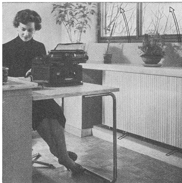
Fig. 8. — Confort et hygiène par le « Jettair » dans ce bureau de fabrique aux fenêtres tenues fermées.

Dans la centrale, l'air frais pris à l'extérieur est purifié par un filtre fin, aspiré par un ventilateur et poussé dans le groupe de traitement d'air primaire. C'est là qu'il subit le chauffage ou le refroidissement préalable, l'humidification ou le séchage ; il est ensuite dirigé vers les appareils « Jettair » par l'intermédiaire des conduites de faibles dimensions. Le traitement complémentaire s'effectue dans l'appareil individuel par l'eau