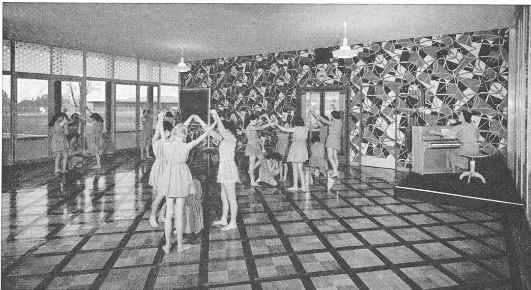
Salle de rythmique.