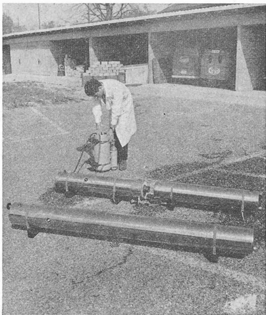
Fig. 1. — Présentation des deux prototypes mis au point. Au premier plan : le générateur thermique CC 451, en une seule pièce ; au milieu : le générateur thermique CC 452, en deux éléments de même longueur ; à l'arrière-plan : l'agrégat de démarrage, en position verticale.

d'eau bouillante, et ceci pour une température initiale de l'eau de 13° C.