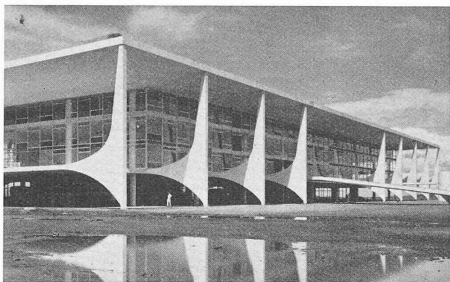
Brasilia. Le Palais du Gouvernement

recouvert d'une coupole normale, la Chambre des Députés, recouverte d'une coupole inversée, et le bâtiment administratif formant deux tours jumelles ; palais de justice et palais du gouvernement, musée, bâtiments des ministères, immeubles d'habitation, cathédrale, école. Charmante réception par Oscar Niemeyer, le créateur de presque tous les bâtiments de Brasilia, qui nous explique ses conceptions architecturales en exécutant sous nos yeux quelques esquisses. Réception le soir à l'hôtel Palace et échange de bonnes paroles avec les chefs de la société NOVACAP, l'organisation gouvernementale responsable de la construction de la nouvelle capitale : D r Pery da Rocha França, D r Silva, D r Kanyo et quelques autres.