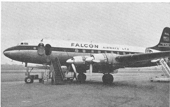
Le « Falcon »

Ce voyage a rencontré le plus grand intérêt parmi les membres de la S.I.A., puisque plusieurs inscriptions n'ont pu être prises en considération. C'est donc que le « Falcon »,