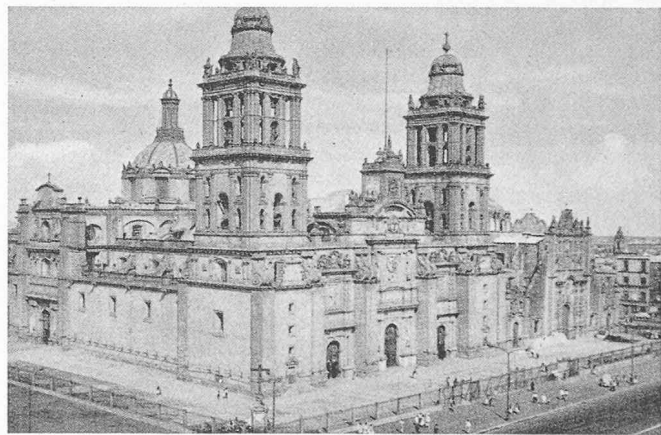
Mexico. La Cathédrale

Vol Caracas-Mexico, avec escale à Montagu Bay (Jamaïque). Arrivée de nuit, impressionnante, sur Mexico. C'est une ville splendide et pittoresque, qui s'enfonce lentement dans son fond lacustre et qui demande aux ingénieurs des solutions originales pour le maintien des maisons, et surtout des gratte-ciel, dans la verticale. Toute l'histoire du Mexique et des anciennes civilisations toltèques et aztèques ressurgit à chaque pas et influence fortement le caractère de la ville. Les constructions modernes, qui sont à l'avant-garde du progrès technique et de l'architecture, utilisent souvent des motifs architecturaux et surtout décoratifs anciens. Le plus bel exemple de cette harmonieuse synthèse est donné par la cité universitaire, un ensemble plein de grandeur. Visite du musée d'archéologie, de la Cathédrale, du Ministère des communications, des quartiers de villas modernes de Pedregal. L'illumination de la place de la Cathédrale, le soir, est un spectacle inoubliable. La société des architectes mexicains organise une réception en l'honneur des participants suisses et l'Ambassadeur de