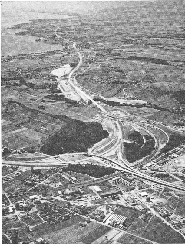
Fig. 2. — Vue aérienne de l'échangeur de circulation d'Ecublens, comprenant à gauche l'embranchement en direction de Lausanne-Sud (Maladière), à droite en direction de Berne et du contournement nord de Lausanne et au nord dans la prolongation, l'autoroute Genève-Lausanne et la traversée de Morges.