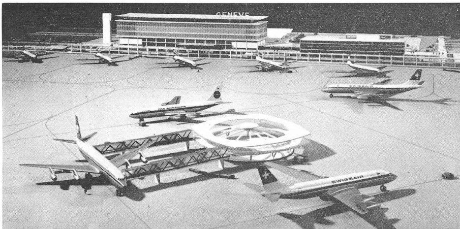
La nouvelle aérogare de Genève-Cointrin. Vue du côté piste. A l'avant-plan : un satellite.

pays, sur l'urbanisme et les liaisons qui permettront aux passagers d'atteindre rapidement la voie des airs. Tout peut être résumé simplement : l'autoroute de Suisse traverse (en sous-sol) la place de l'aérogare et est reliée à celle-ci par des bretelles ad hoc, une gare de chemin de fer à rebroussement est prévue afin d'avoir la liaison ferroviaire avec les principales villes de l'ouest de la Suisse et de la Savoie, l'accès à Genève étant pratiquement le même que celui que nous avons maintenant, le centre de la ville se trouvant à cinq kilomètres de l'aérogare. Un parking important est prévu autour des bâtiments, parking très « différencié », permettant de résoudre, pour l'instant, le problème chaque jour plus impératif du logement des véhicules à moteurs. Une