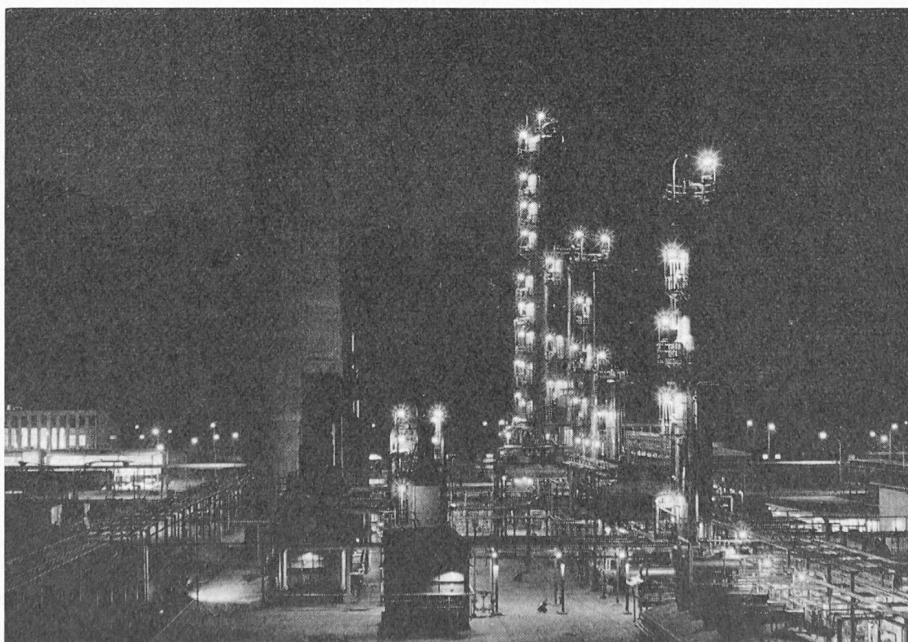
Fig. 27 — Les Raffineries du Rhône de nuit.