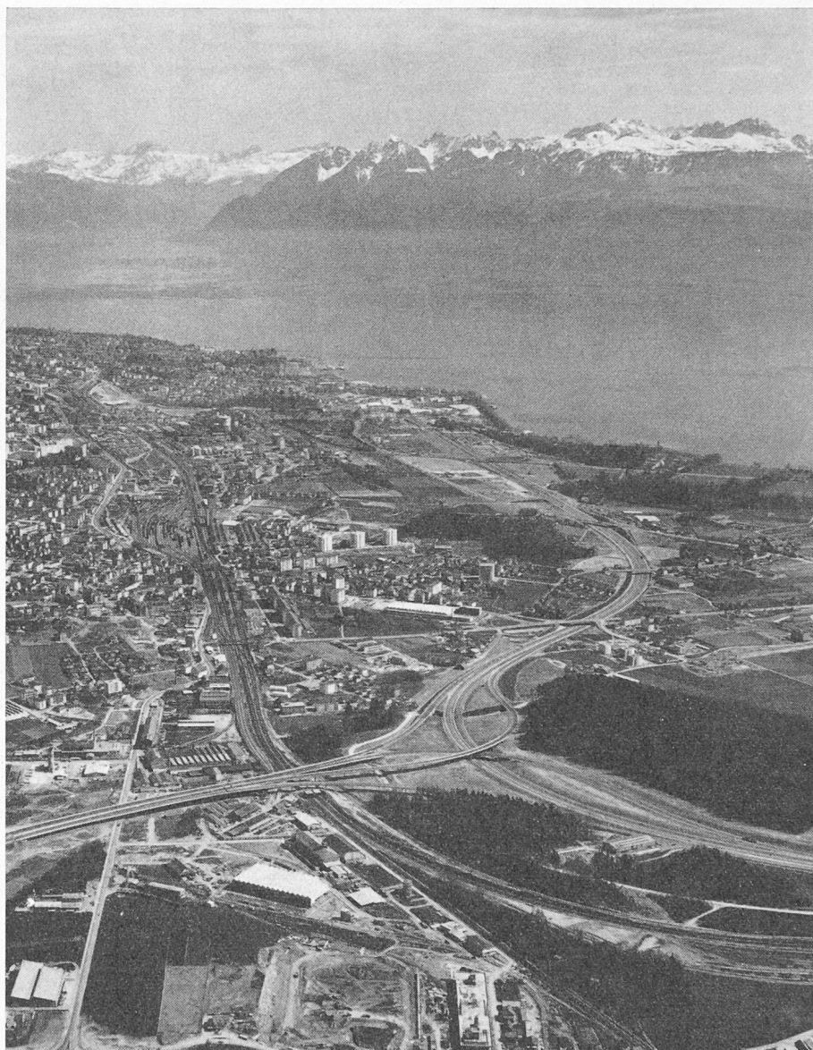
Fig. 33 — Autoroute Genève-Lausanne-Berne. Echangeur de circulation d'Ecublens. Vue aérienne.

Le constructeur de ponts est tributaire pour l'élaboration de son projet, de nombreux facteurs, qui souvent lui imposent la solution sur le plan technique.