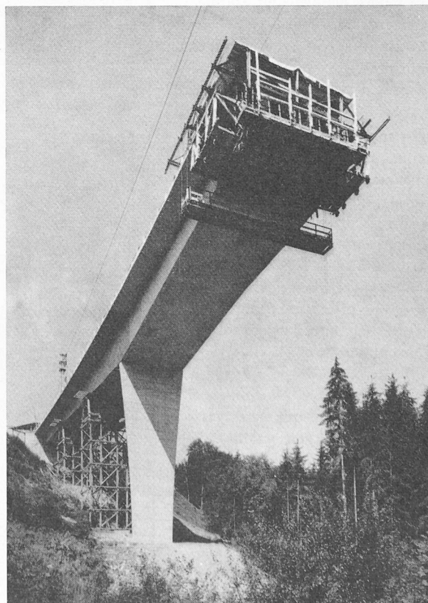
Fig. 36 — Autoroute Lausanne-Saint-Maurice. Pont sur la Sorge.

Il est donc très souhaitable que l'architecte soit consulté dès le début de l'étude. En effet, sans que le coût d'un ouvrage soit nécessairement augmenté ou que les critères techniques déterminants pour le choix en soient modifiés, il peut souvent améliorer sensiblement l'esthétique et intégrer la construction dans son cadre naturel.