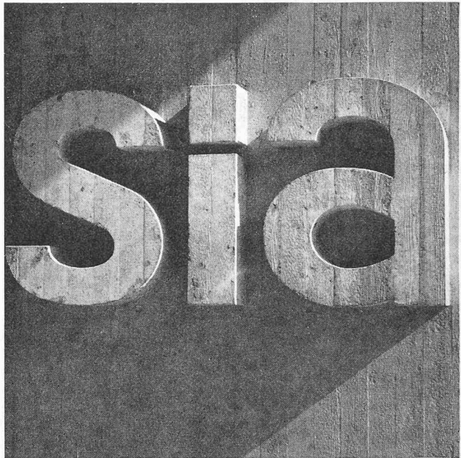
Ce sigle vous accueillera à l'entrée de la maison SIA.

Ce groupe a organisé, en collaboration avec l'Association suisse de fabricants d'objets en matière plastique un séminaire sur les matières plastiques et notamment sur l'emploi