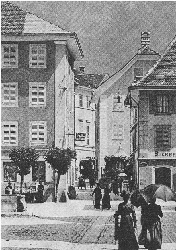
Altdorf (Suisse) vers 1910.