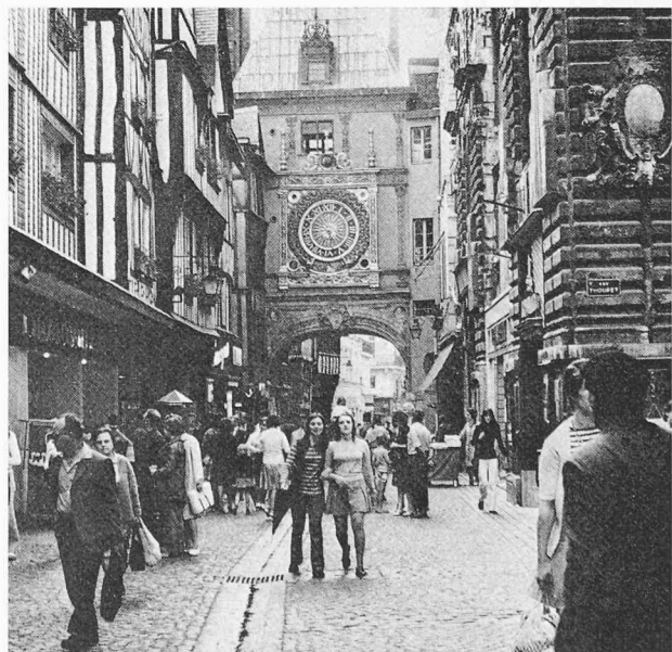
La réglementation actuelle interdit le passage des voitures ; les trottoirs sont supprimés, les enseignes, les auvents et les stores réglementés ; la circulation est devenue agréable, les maisons sont mises en valeur et le commerce a prospéré.