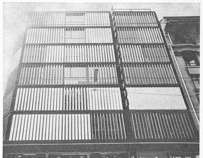
Fig. 4 et 5. — Deux récents exemples de la mode du brise-soleil genevoise. Les façades photographiées sont orientées vers le nord . L'inopportunité des protections solaires est évidente.