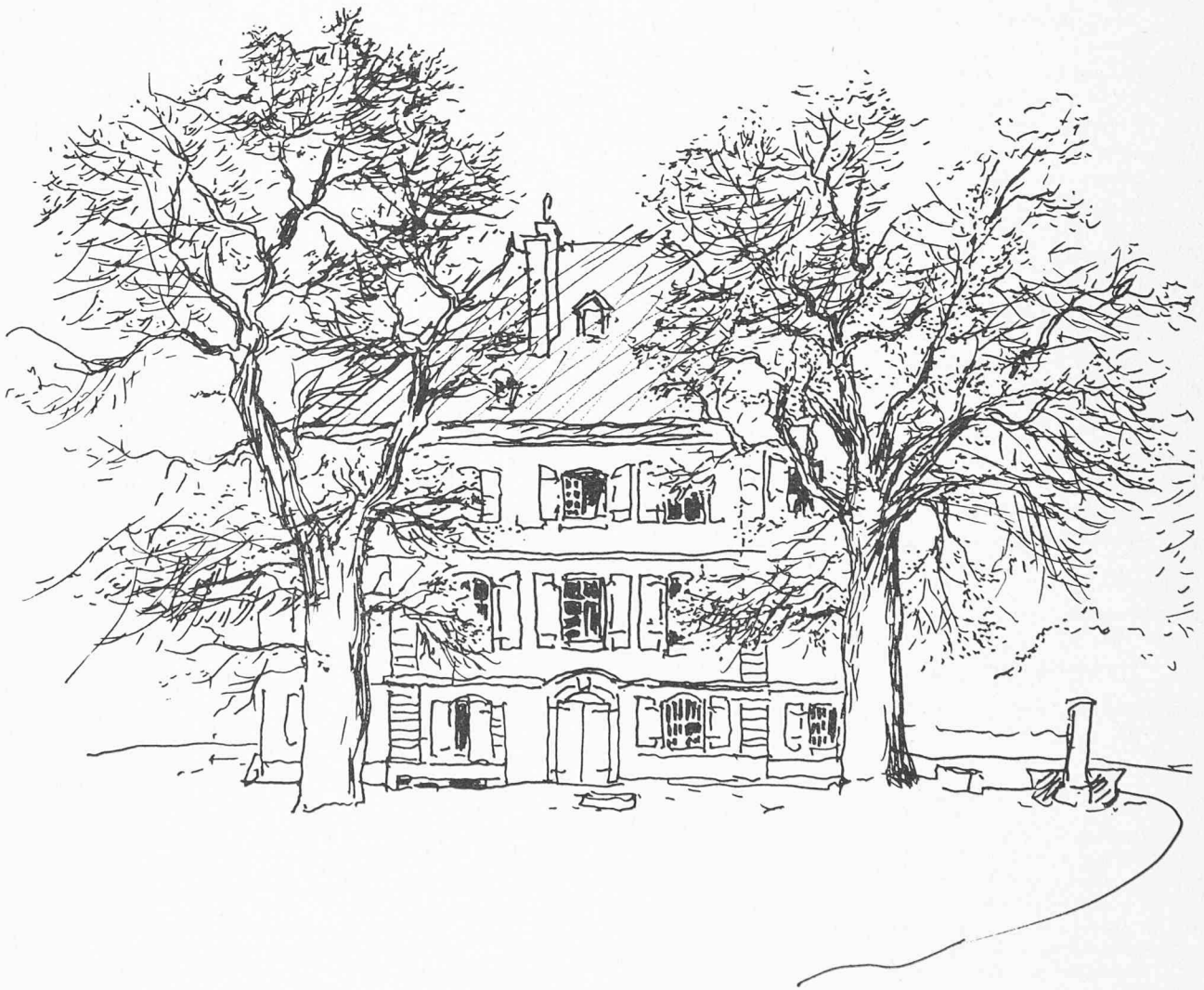
Fig. 1. — Demeure du 18 e siècle dans la campagne genevoise.

Un argument appuie notre intrusion : le devoir basé sur l'éthique professionnelle, sur l'exercice du métier d'architecte intra muros genevensis durant plus d'une décennie. Le délai d'assimilation étant suffisant pour permettre de sentir les éléments du puzzle dans la plupart de ses aspects, nous pouvons donc avancer nos hypothèses.