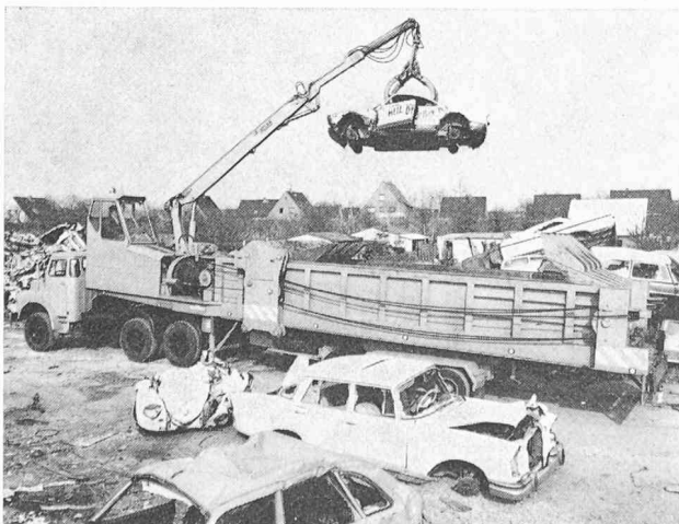
Le nouvel autocracker Krupp.

De robustes câbles d'acier tirés par un puissant treuil, entraînent, en parfaite synchronisation, le bouclier de l'autocracker vers l'avant et vers l'arrière. Le groupe Diesel de bord alimente en énergie le système hydraulique qui, par l'intermédiaire d'un engrenage à roues droites, assure la commande du tambour