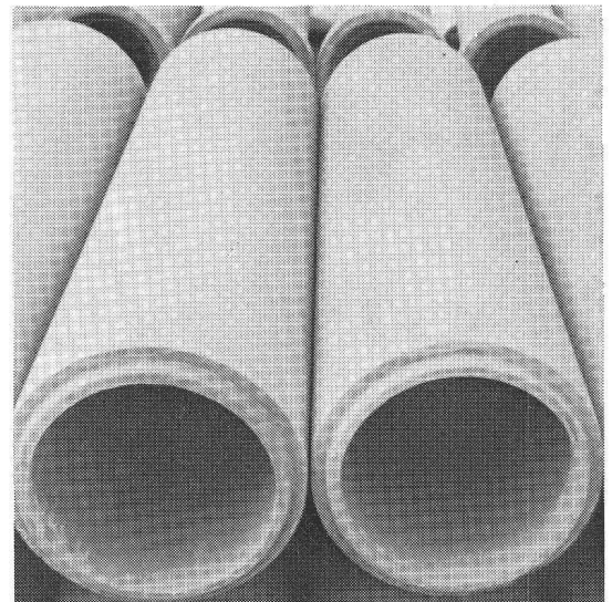
Nouvelle unité de production de tuyaux en béton vibré chez Desmeules Frères SA à Granges-Marnand.