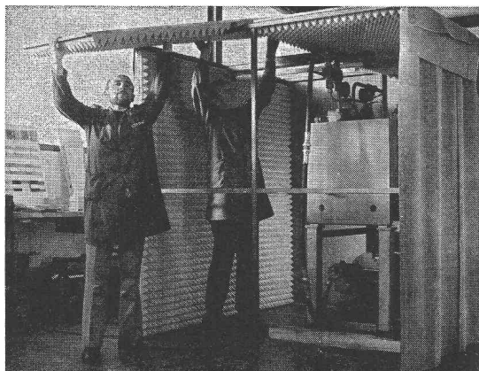
Montage d'une cabine anti-bruit

Les nuisances du bruit se font remarquer dans tous les domaines. Le bruit trop excessif présente un grand danger pour notre environnement.