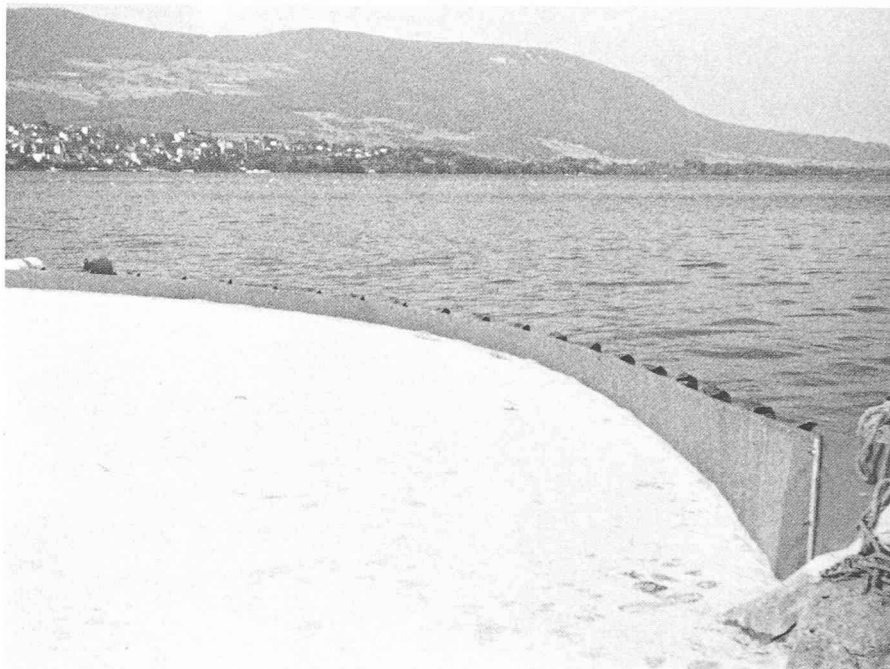
Fig. 6. — Il est parfois nécessaire de placer le barrage à l'embouchure d'une rivière dans un lac, lorsque le courant est trop important pour stopper la pollution en amont.

En cas d'interventions sur les lacs, la Société internationale de sauvetage du Léman a communiqué à l'Office de la protection des eaux la liste des bateaux que chacune de ses sections peut mettre à disposition sur simple appel téléphonique.