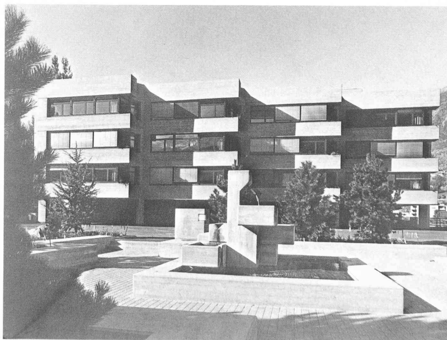
Des besoins impératifs : école régionale à Viège.

Ainsi, à fin avril 1979, l'on constate que 127 communes sur 163, soit plus des trois quarts, disposent d'un plan de zones et d'un règlement sur les constructions en vigueur, issus généralement d'une étude d'aménagement local effectuée par des bureaux privés d'aménagement du territoire et subventionnée à 60 % par les pouvoirs publics. Au niveau de la population, ces 127 communes abritent 87 % de la population totale du canton. Les 36 communes restantes ont quant à elles toutes entreprises des études d'aménagement local