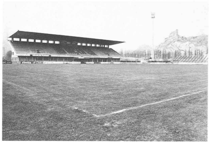
Aménager en vue de loisirs plus ou moins actifs (à gauche : centre de cours et de repos de Fiesch ; à droite : tribune principale du stade de Tourbillon à Sion).

situées à des stades plus ou moins avancés d'élaboration. Bien sûr, tous les aménagements locaux n'ont pas débouché sur un résultat que l'on pourrait qualifier d'idéal. Mais il a fallu tenir compte dans leur établissement d'une foule de facteurs dont certains sont propres au Valais, tels tout d'abord la procédure