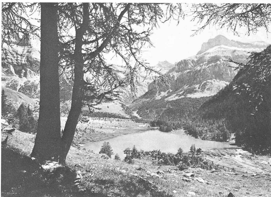
Protection absolue d'un site : Derborence.

Toutes les communes du canton ont ainsi été réparties en huit régions. Quatre d'entre elles (Conches, Brigue-Rarogne oriental, Viège-Rarogne occidental et Loèche) ont déjà vu leurs programmes