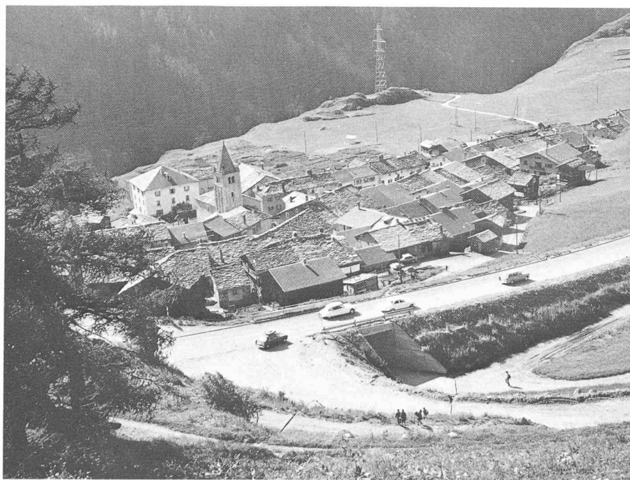
L'aménagement doit tenir compte des besoins, mais aussi des sites et du patrimoine architectural (Bourg-Saint-Pierre).

Le premier constat qu'il convient de faire à ce sujet, c'est que le canton du Valais ne possède pas de base légale propre en relation avec l'aménagement du territoire. Tout au plus dispose-t-il d'une loi sur les constructions datant du 19 mai 1924 et autorisant les communes « à établir des règlements sur la police des constructions dans le but de favo-