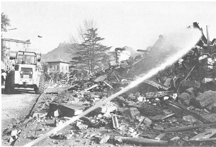
Fig. 7. — Vue des débris, 30 minutes après le tir ; la route et le trottoir sont lavés et le chantier fermé au public. La chaussée de la Via Maraini a été fermée pendant 11 minutes au total (ci-contre).