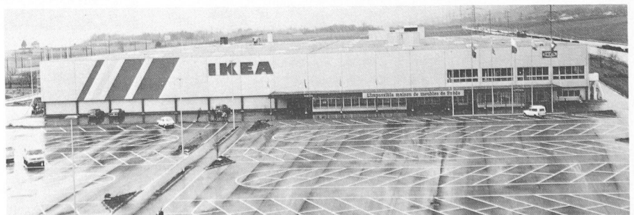
Les bâtiments prêts pour l'inauguration.

Ils ont été traités comme des colonnes métalliques avec plaques de base boulonnées sur plaques prescellées et incorporés, avec des douilles Brugg pour la réception des sommiers des planchers intermédiaires.