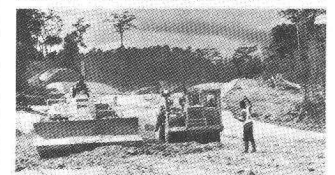
Photo du haut: Jeddah, Arabie Séoudite, 1976-78. Construction de la centrale thermique et de l'usine de dessalement de l'eau de mer.

Photo du bas: Voie Express du nord Abidjan-N'Douai, Côte d'Ivoire, 1975-81. Autoroute à 2x2 voies reliant Abidjan au nord du pays: Longueur des 1 re et 2 e étapes: env. 190 km.