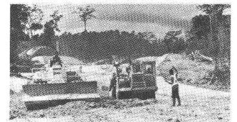
Photo du haut: Jeddah, Arabie Séoudite, 1976-78. Construction de la centrale thermique et de l'usine de dessalement de l'eau de mer.

Photo du bas: Voie Express du nord Abidjan-N'Douci, Côte d'Ivoire, 1975-81. Autoroute à 2x2 voies reliant Abidjan au nord du pays: Longueur des 1 re et 2 e étapes: env. 190 km.