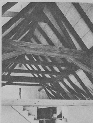
600 m 2 de Schichtex Spécial 75/111 , face visible peinte à la dispersion, posée sur chevrons.

Il s'agit d'une sous-toiture destinée aux usagers les plus variés et d'un prix avantageux, servant d'une part de toiture et constituant d'autre part tout à la fois une isolation efficace, le plafonnage et la sous-face terminée. Ce panneau se compose d'une âme en mousse de polystyrène rigide PS 20 difficilement inflammable et de deux couches de revêtement faites de plaques stratifiées à base de fibres de 3,2 mm d'épaisseur à surface lisse et face supérieure hydrofuge. Traitement de la face visible à volonté. Epaisseurs 60, 80, 100 et 120 mm. Avec le Schichtex , la sous-toiture BI est le seul élément de sous-toiture d'un usage aussi universel. Le perfectionnement systématique des produits éprouvés Schichtex , Zemtex et BI ne peut échapper au visiteur. La sous-toiture Schichtex présente les mêmes avantages que