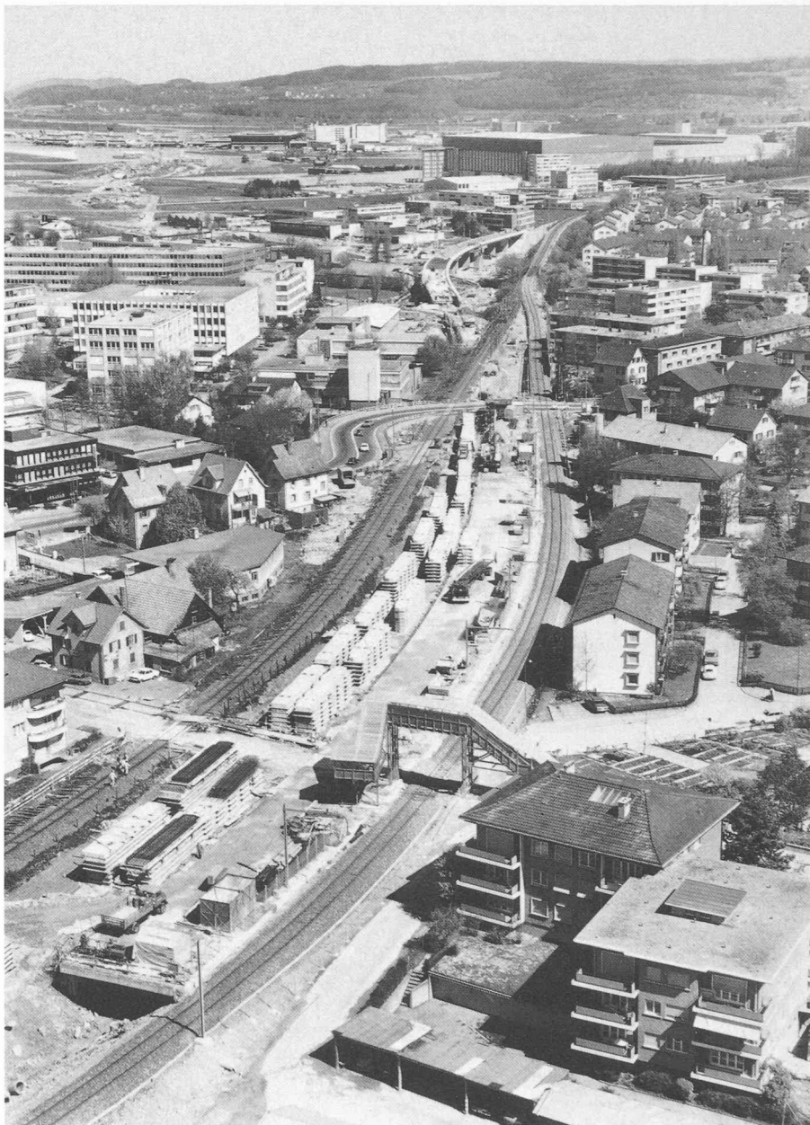
Fig. 1. — Opfikon. Vue générale des travaux en juin 1977, après le ripage provisoire de la ligne de Kloten (à gauche, l'ancien tracé).

Deux systèmes distincts sont utilisés pour l'assèchement de la tranchée. Une couche filtrante d'environ 90 cm d'épaisseur sert à endiguer le courant d'eau souterraine et à le dévier vers les drains établis en direction de la Glatt.