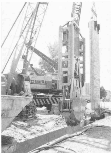
Fig. 2. — Creusage d'une tranchée et mise en place d'un élément de paroi préfabriqué.