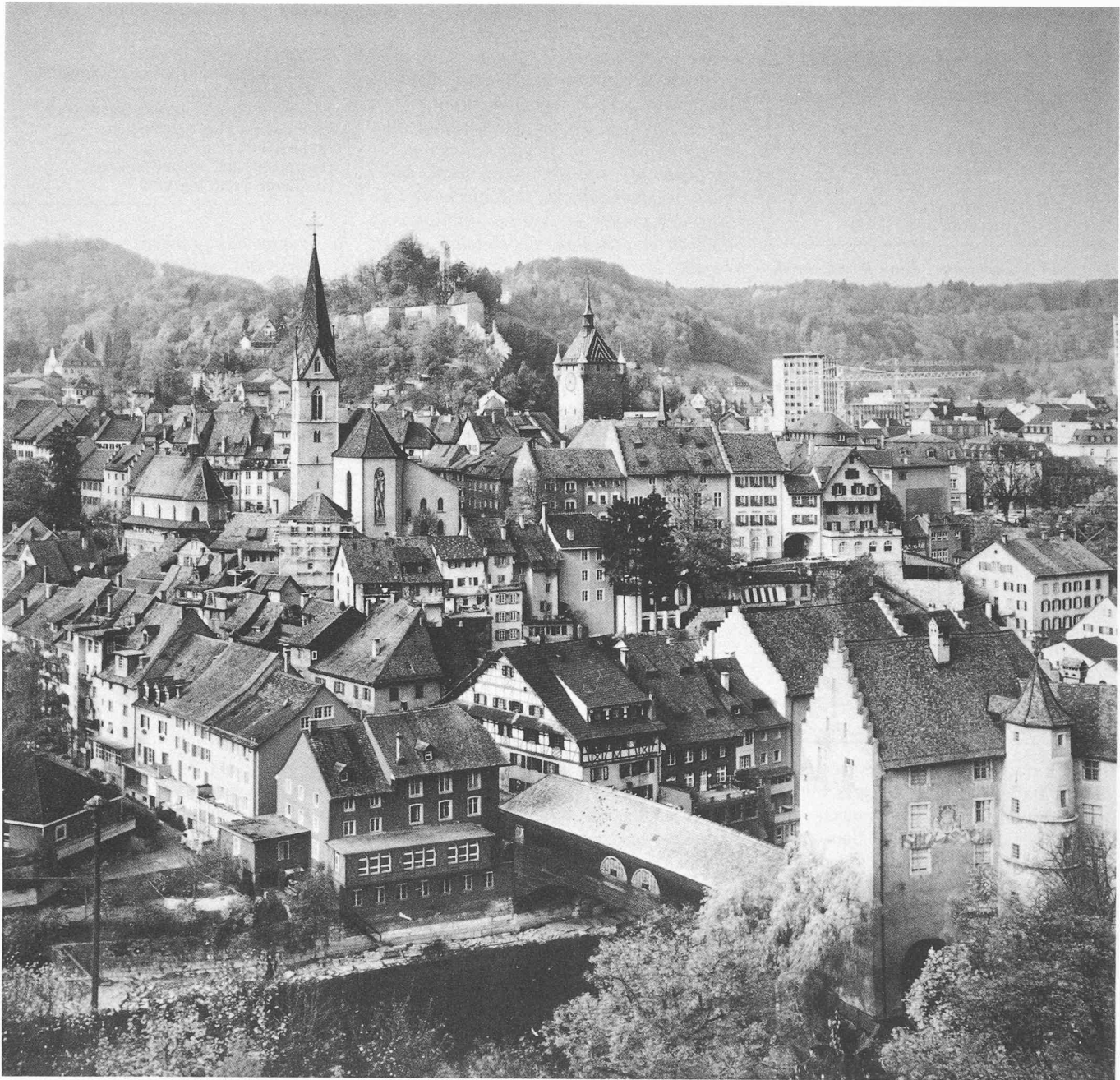
Vue sur la vieille ville de Baden.

puis la construction de son Kursaal, il y a plus d'un siècle, en 1874, que Baden est un lieu de rencontre dans l'acception actuelle du terme.