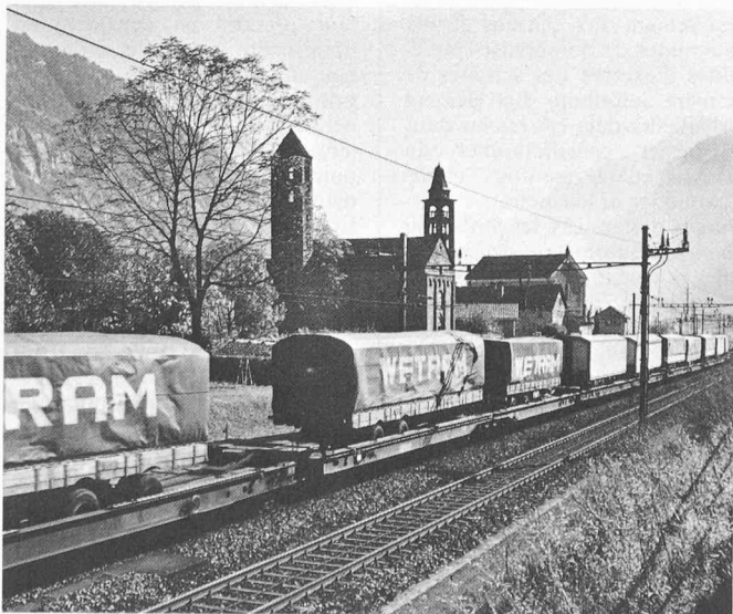
La coordination des transports et l'économie d'énergie sont étroitement liées: le ferroutage en est un excellent exemple.

Le contrat d'entreprise qui vient d'être établi définit la mission des CFF et les diverses prestations de service public qu'ils sont tenus de fournir ainsi que la façon d'indemniser équitablement celles-ci. Pour le reste de leur activité de transport, il doit bénéficier de la plus grande liberté commerciale possible, afin qu'ils parviennent au mieux à une ges-