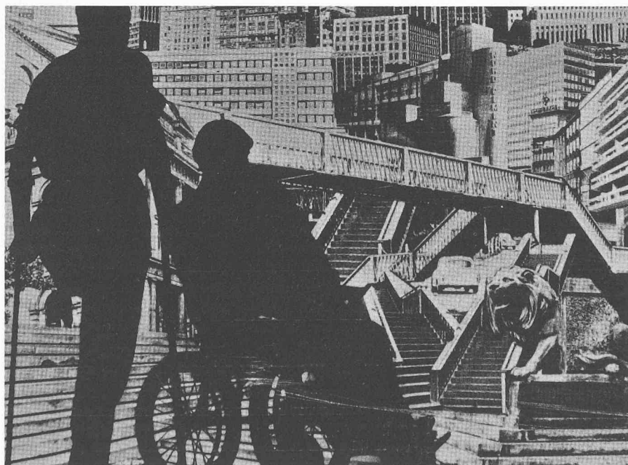
Ces invalides, pour qui une banale bordure de trottoir constitue un obstacle infranchissable ou un danger quotidien, ce peut être demain chacun d'entre nous, ou un être qui nous est cher. Que nous coûte-t-il de penser à temps à éliminer les barrières architecturales, si l'on songe aux efforts déployés par les handicapés pour oublier et faire oublier leur handicap ainsi que par ceux qui se dévouent pour eux?

Message de M. Ernst Brugger, ancien conseiller fédéral, à la Conférence suisse de la construction.