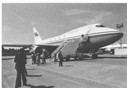
Le Boeing 747 SP

Ce qui m'a aussi frappé, au MIT, c'est la grande différence entre les moyens à disposition de l'enseignement, qui m'ont semblé fort sommaires, et ceux destinés à la recherche, très modernes et complets.