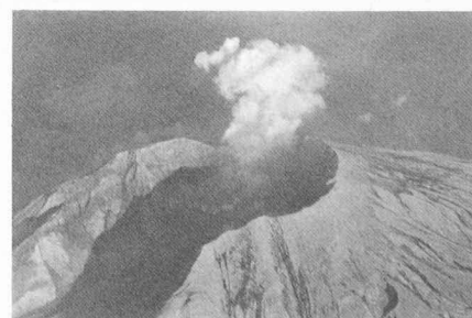
L'éruption du Mont St. Helens vue d'avion.

Cette conférence durait 2 semaines et était en fait très compartimentée, se répartissant simultanément en différents points, ce qui obligeait à des choix.