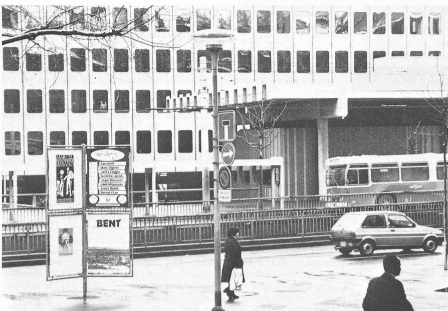
La ville moderne: quel dialogue?

Le deuxième élément explicatif de la dégradation des villes est le développe-