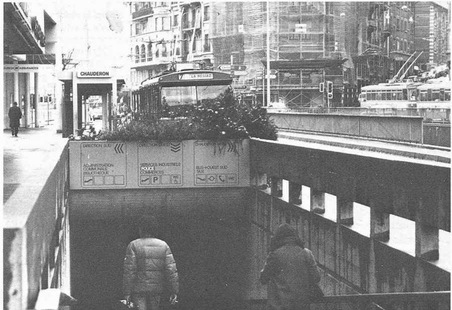
Enterrement des éléments du conflit: rupture institutionnalisée?

D'abord, la description. Les orateurs et contradicteurs étaient d'accord qu'en matière urbaine il y a dégradation sensible. Cette constatation était, certes, nuancée selon les sujets abordés: les uns voient en cette dégradation la mort du