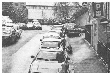
Le renversement des rôles: l'automobile est présentée comme un outil, comme un instrument au service de l'homme, qui est censé lui ouvrir des horizons nouveaux. En ville, c'est le contraire qui est vrai. Partout, l'individu doit céder devant les exigences du serviteur devenu oppresseur, dévoreur d'espace au point qu'il finit par reléguer l'homme sous terre, isolé de la vie des saisons.

ment inadapté de la technique conçue d'abord pour améliorer la condition de vie des citadins (au plan de l'hygiène, du confort, des transports, etc.); elle dénature la ville en devenant élément structurant. Elle éloigne les hommes les uns des autres et de la nature.