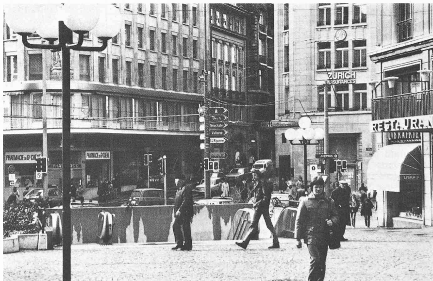
L'individu, l'habitant de la cité retrouve-t-il l'âme de sa ville dans les espaces mi-rétros mi-aseptisés que lui proposent ses édiles?

Ces luttes peuvent être considérées comme le reflet de l'opposition entre l'utilisateur-consommateur et la technocratie.