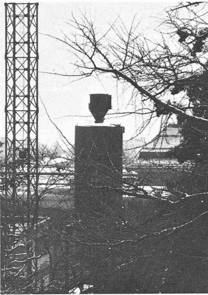
La ville, lieu privilégié de la lutte entre la technique et la nature: chaque arbre est le symbole du paradis perdu.

Dans une telle société, la difficulté est grande, voire insurmontable de former et d'exercer une volonté politique. Le plan est inscrit dans les faits et non dans les textes par ceux qui exercent le pouvoir réel, notamment le pouvoir économique au niveau international, les décisions y relatives étant prises loin des villes et des régions concernées. A cela s'ajoute que, pour des raisons déjà évo-