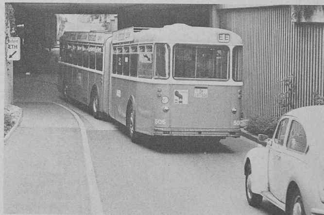
Une rame d'autobus circule dans le tunnel de l'EPFZ.

lors de fortes pressions superficielles.